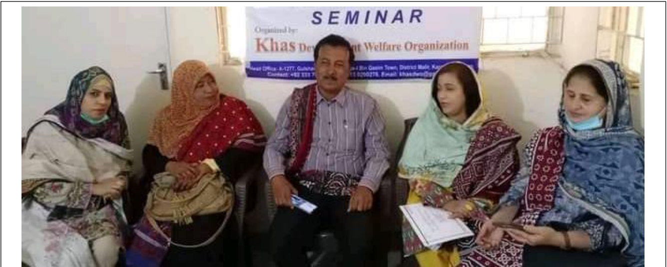
پاکستان خاص خیلی اتحاد پاران ہلندرز خاص ڈولپمینٹ ویلفیئر آرگنائیزیشن سنڈ پاران سرگرمیوں