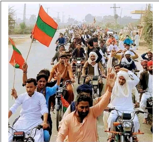
بدين جي شهر تلهار جي ۾ ريلي دوران

پيغام لطيف چواڻي ته: ستا اتي جاڳ نند نه ڪجي ايتري.