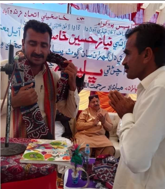
ميانداغ خاصخيلي جي پروگرام ۾ (نارو)