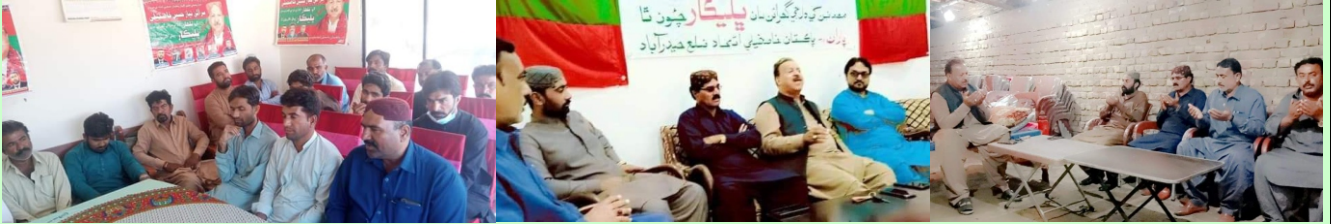
حيدرآباد ضلعي جون سياسي سماجي سرگرميون