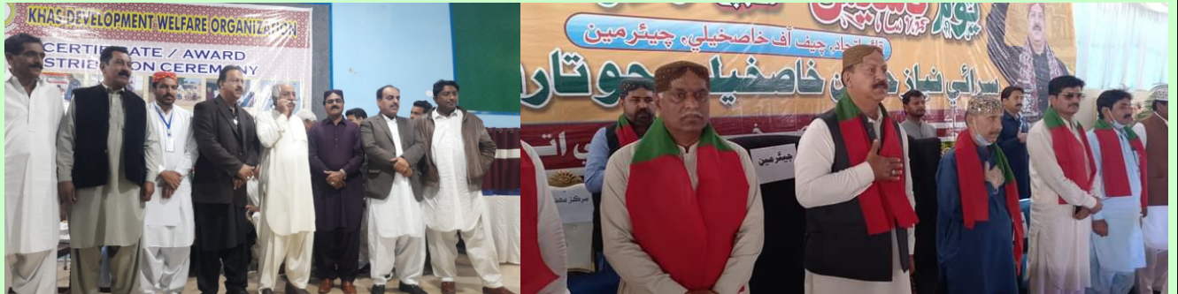
خاص ڊولپمينٽ ويلفيئر تنظيم حيدرآباد