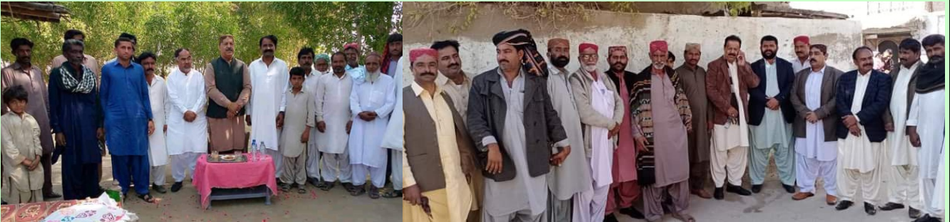
بدين ضلعي جون سياسي سماجي سرگرميون