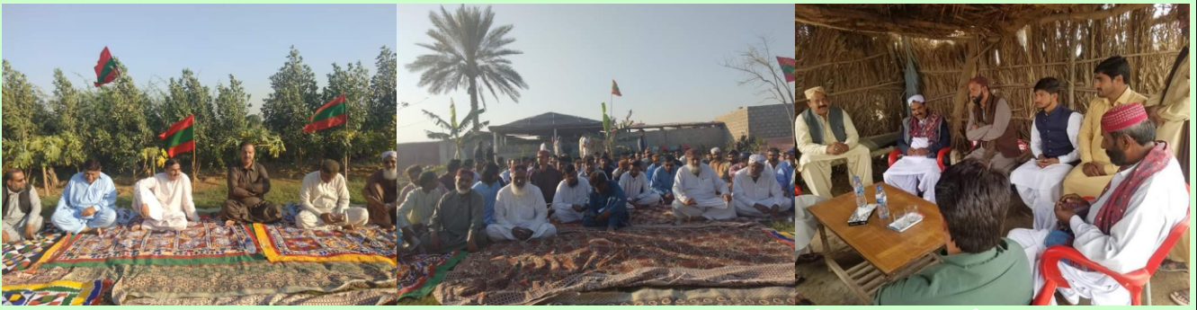
گند جنين جي ڳوٺ ۾ پاپوڙاپوشاڪ انهن جي اوطاق راجاريجهي آيو.