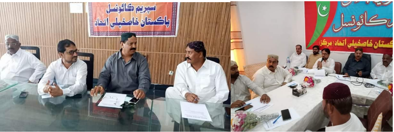
2021 جو سپریم ڪائونسل جو اجلاس