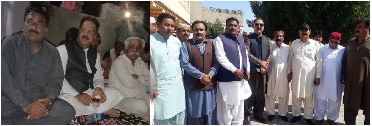
ضلع نوشهرو فيروز ۾ مري ذات پاران شهيد ڪيل خاصخيلي برادري جي تڏي