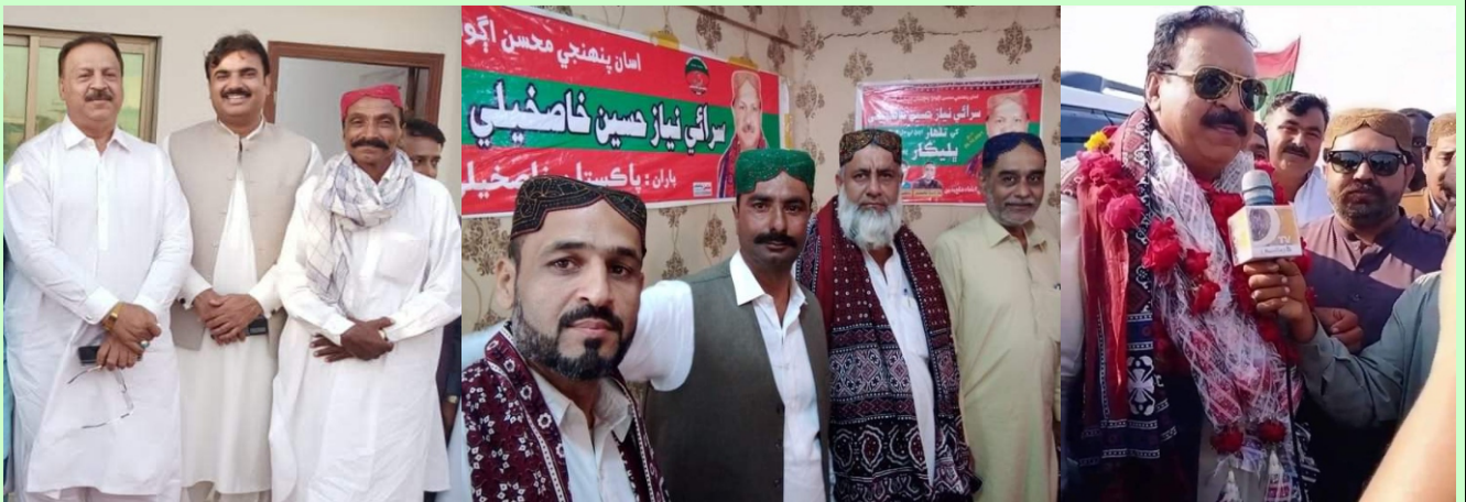
يومر تاسيس 2021