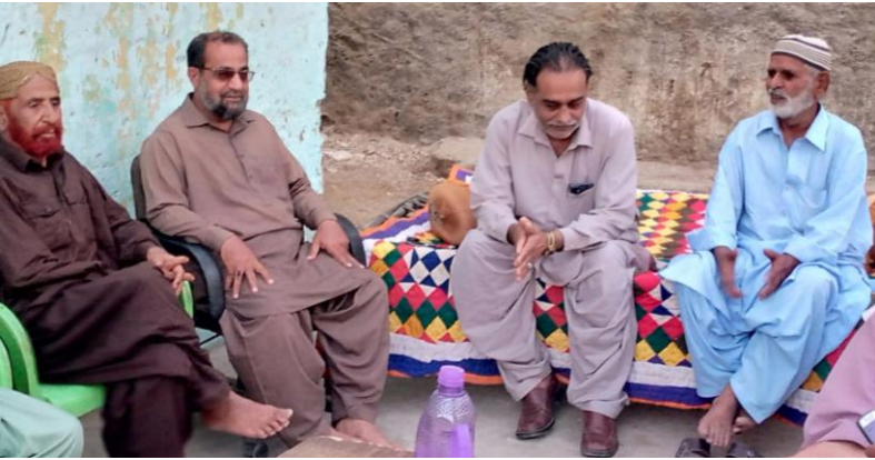
ڪراچي جا عهديدار دوست يور تاسيس جي تيارين ۾